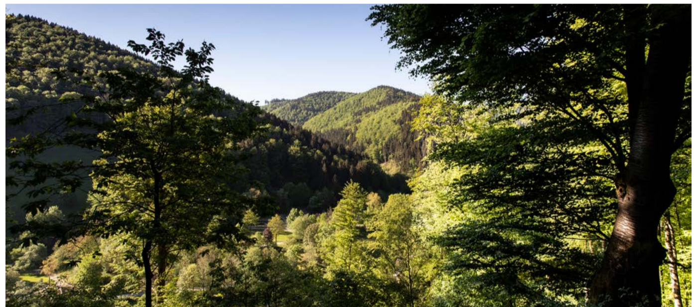
Der Wald zeigt sich nach den guten Witterungsbedingungen 2023 in diesem Frühjahr von seiner schönsten Seite, wie hier im Kellwassertal nahe Torfhaus im Harz.