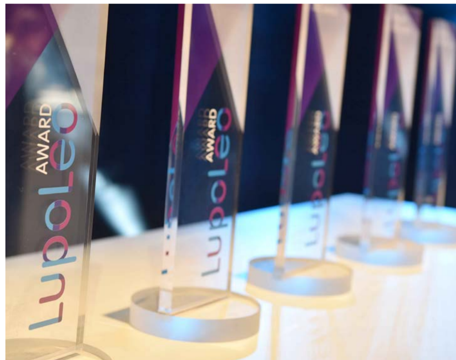
Der LupoLeo Award wird auch 2024 in den Kategorien „Projekt Award“, „Persönlichkeit des Jahres“ und „Wahre Helden“ vergeben.

Für die Auszeichnung wurden im Vorfeld sieben prominente Persönlichkeiten von dem gemeinnützigen Analysehaus Phineo gAG als neutrale Instanz nominiert. Das Jugendkomitee hat aus diesen nun die „Persönlichkeit des Jahres“ gewählt und die drei Finalisten kommuniziert: Komikerin, Sängerin und Schauspielerin Carolin Kebekus, Chemikerin, Youtuberin und Wissenschaftsjournalistin Mai Thi Nguyen-Kim und der ehemalige Formel-1-Weltmeister Sebastian Vettel sind in der Endauswahl.