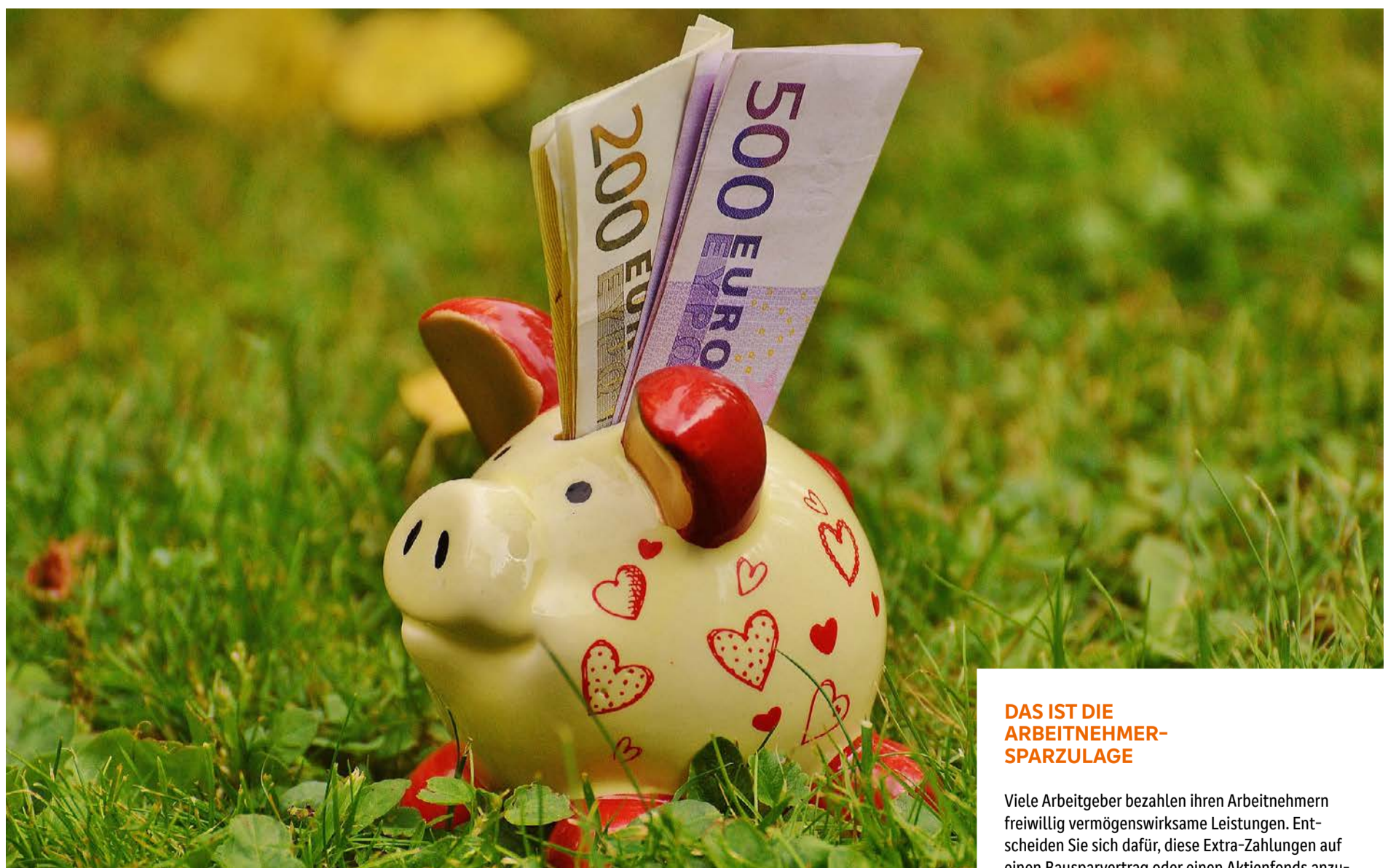
Da freut sich das Sparschwein: 2024 steigt die Arbeitnehmer-Sparzulage.