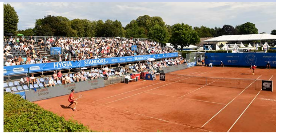
Großer Sport und große Künstler: Das Programm zu den BRAWO OPEN 2024 bietet alles, was Tennis- und Partyfreunde begeistert.