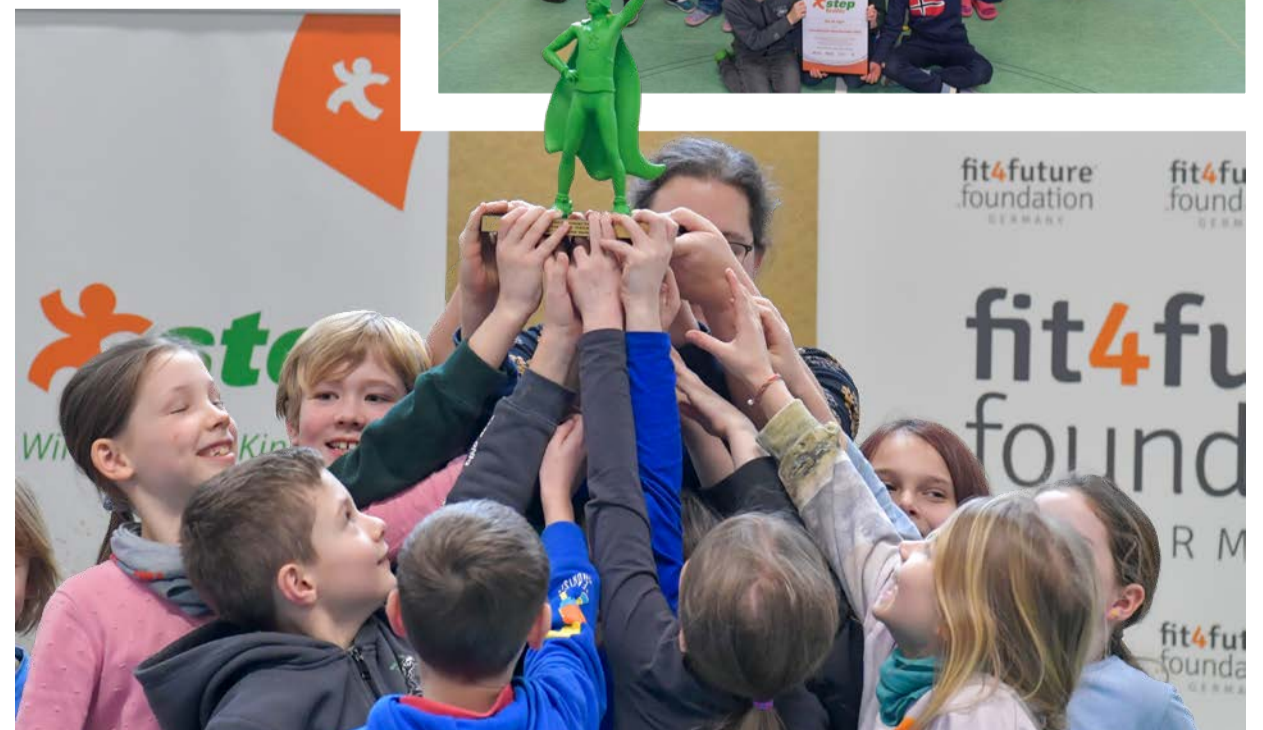
„Die 3b-Tiger“ der Grundschule Mascheroder Holz erhielten die Pokale für den step BRAWO-Sieg sowie den Bundeslandsieger Niedersachsen beim step-Wettbewerb, Urkunden und 500 Euro für die Klassenkasse.