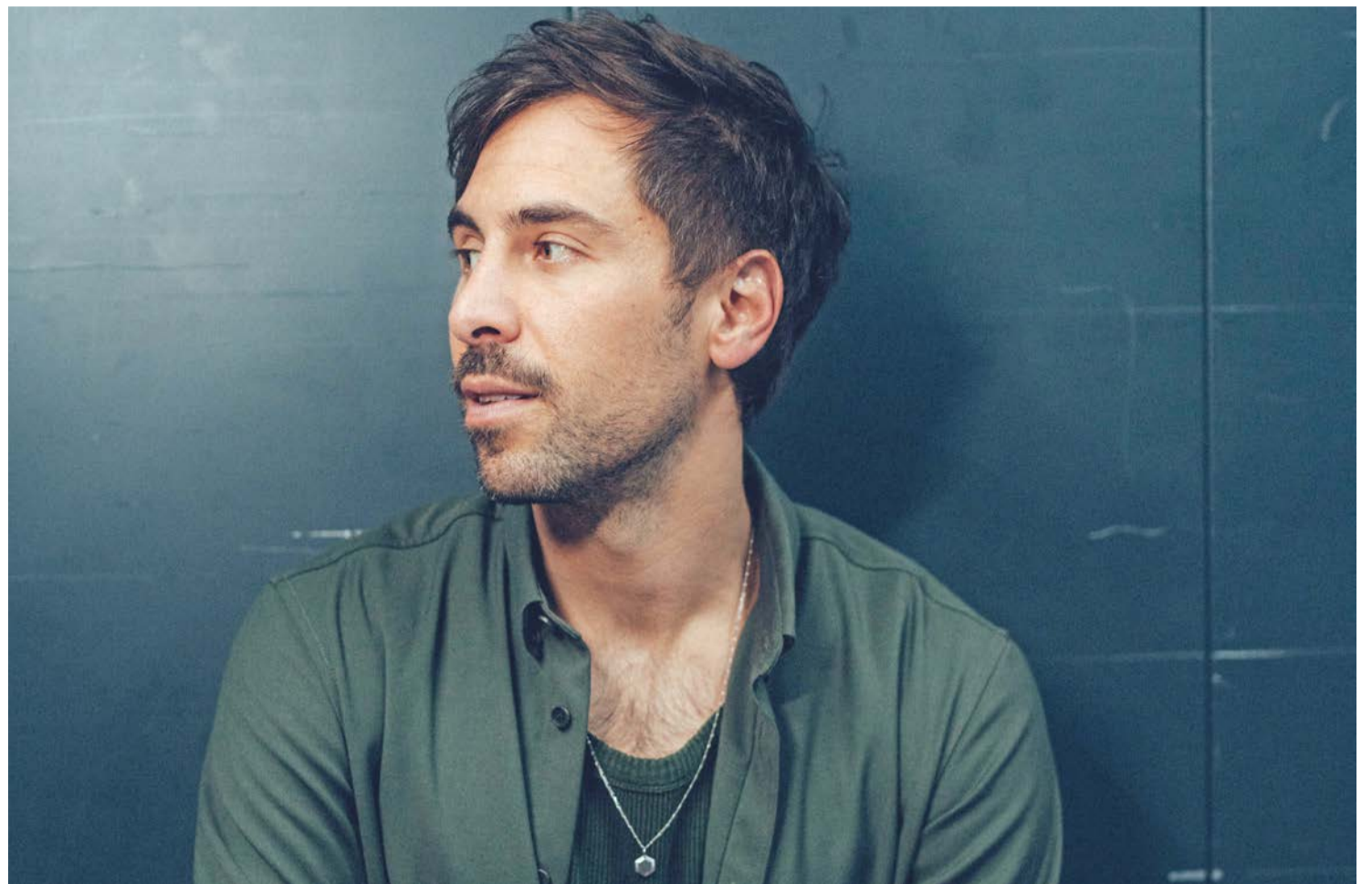
BRAWO-MeinKonto empfehlen und VIP-Tickets für Singer-Songwriter Max Giesinger gewinnen.

Mehr Informationen zum kostenlosen Girokonto der Volksbank BRAWO gibt es unter brawo-meinkonto.de