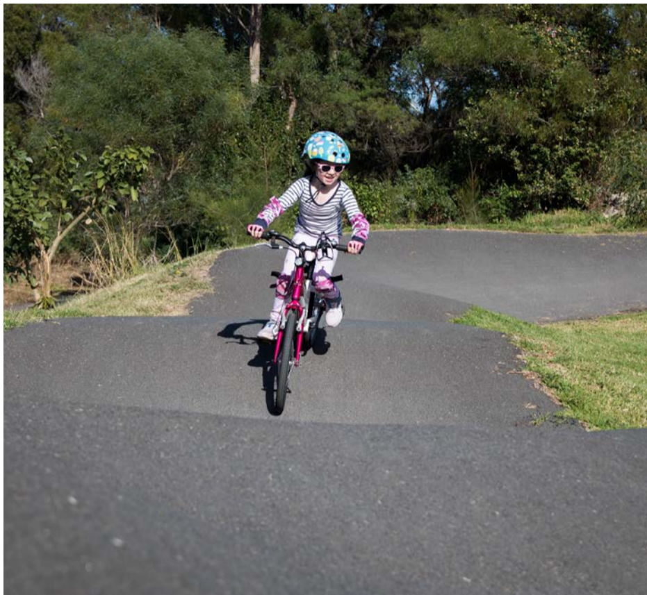
Ein Pumptrack, ein asphaltierter Rundkurs für Fahrräder, soll Teil des Projekts werden.