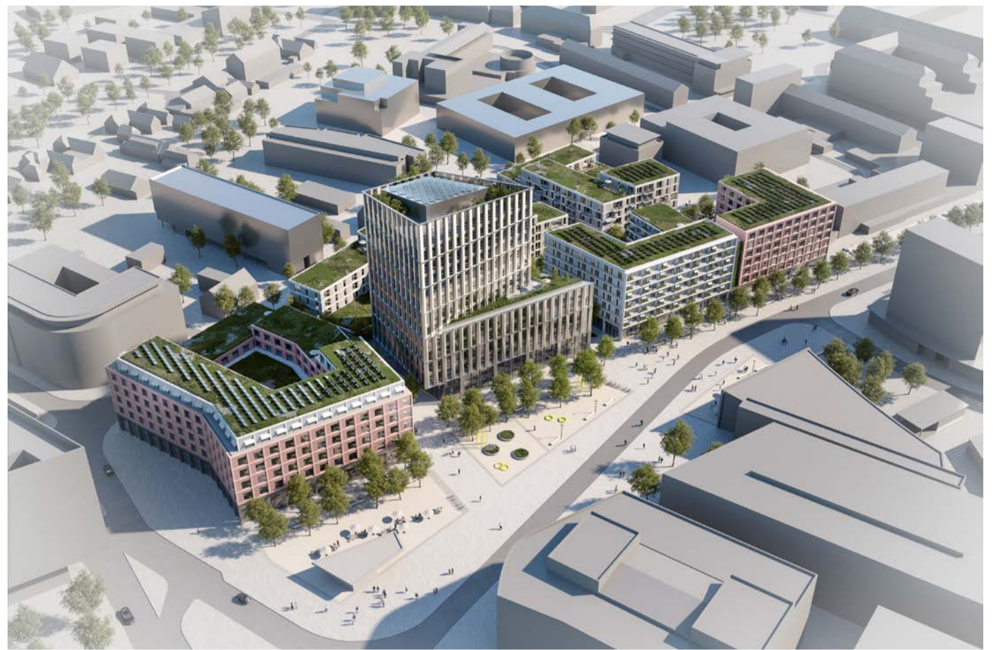
Der Gewinnerentwurf des Architekten-Wettbewerbs von KSP Engel für die BRAWO City in Wolfsburg.

Geplant ist, dass das Areal sich durch einen Mix aus Wohnen, Büro, Einzelhandel und Gastronomie sowie durch attraktive Fassaden und eine nutzerorientierte Außenraumgestaltung auszeichnen soll. Als Erkennungsmerkmal fungiert ein 13-geschossiges Hochhaus, das mit den Hochhäusern in unmittelbarer Umgebung